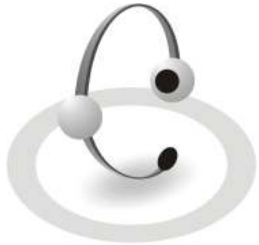
SwyxIt! USB Headset

Das Headset ist die optimale Lösung für Vieltelefonierer oder zentrale Vermittlungsplätze. Mit einem Headset (Kopfhörer und Mikrofon) können Benutzer während eines Telefonats gleichzeitig den Computer bedienen. Die Headsets sind USB-kompatibel und können überall im Büro, auch in Verbindung mit einem SwyxPhone, eingesetzt werden. Geringe Abmessungen und ein niedriges Gewicht machen sie auch zu einer idealen Lösung für mobile Mitarbeiter, die oft unterwegs sind, aber dennoch auf das Unternehmensnetzwerk und SwyxWare zugreifen müssen. Mit den schnurlosen Headsets H350 und H360 können sich Benutzer von ihrem Arbeitsplatz entfernen und bleiben dennoch innerhalb ihrer Arbeitsumgebung erreichbar – eine wirklich mobile Lösung.