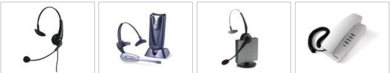
SwyxIt! USB Handset

Das Telefonieren mit dem SwyxIt! Handset P250 ist einfach und bequem. Das Handset wird an den USB-Anschluss von PC oder Laptop angeschlossen und unterstützt das Abnehmen bzw. Auflegen des Hörers (Gabelfunktion). Die Eingabe von Rufnummern erfolgt mit der Computertastatur oder per Mausklick. Wichtige Telefoniefunktionen wie Verbinden, Halten, Weiterleiten oder Konferenzen können mühelos auf der Benutzeroberfläche von SwyxIt! ausgewählt werden, so dass die Umstellung von einem herkömmlichen Telefon auf ein USB-Handset denkbar einfach ist.