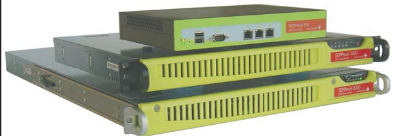
SEPPmail 500 SEPPmail 1000 SEPPmail 3000